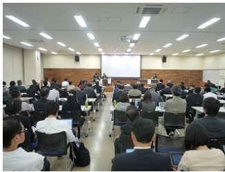
(藤沢市などからの負担金事業)